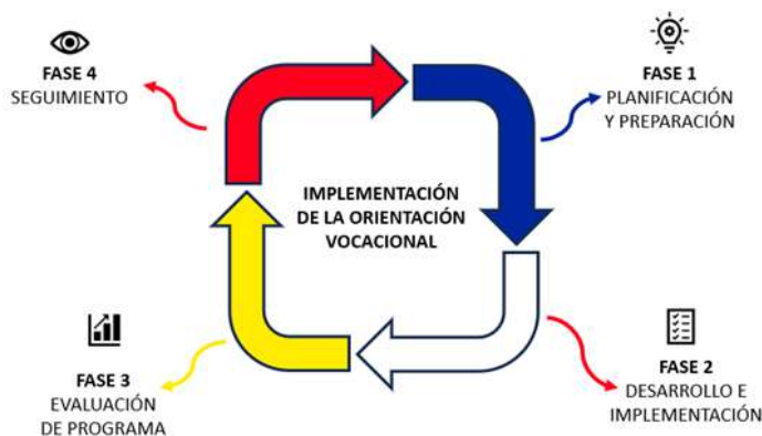
Imagen N°1 Fases de Implementación

Como producto de las reflexiones y análisis del Taller de Interaprendizaje se construyen las FASES que permitirán conformar y consolidar la Guía de Orientación Vocacional para el Sistema de la Universidad Boliviana, detallando dichas fases a continuación.